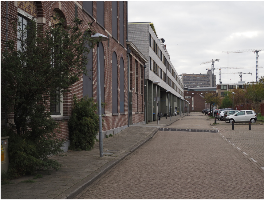
De ingang van het theater.