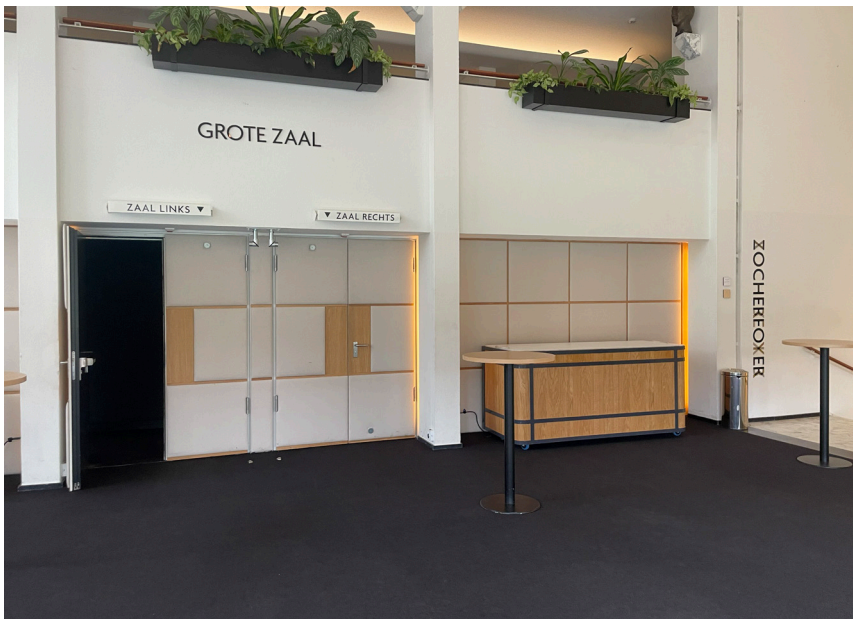
Dit is hoe de binnenkant van de Grote zaal eruit ziet.