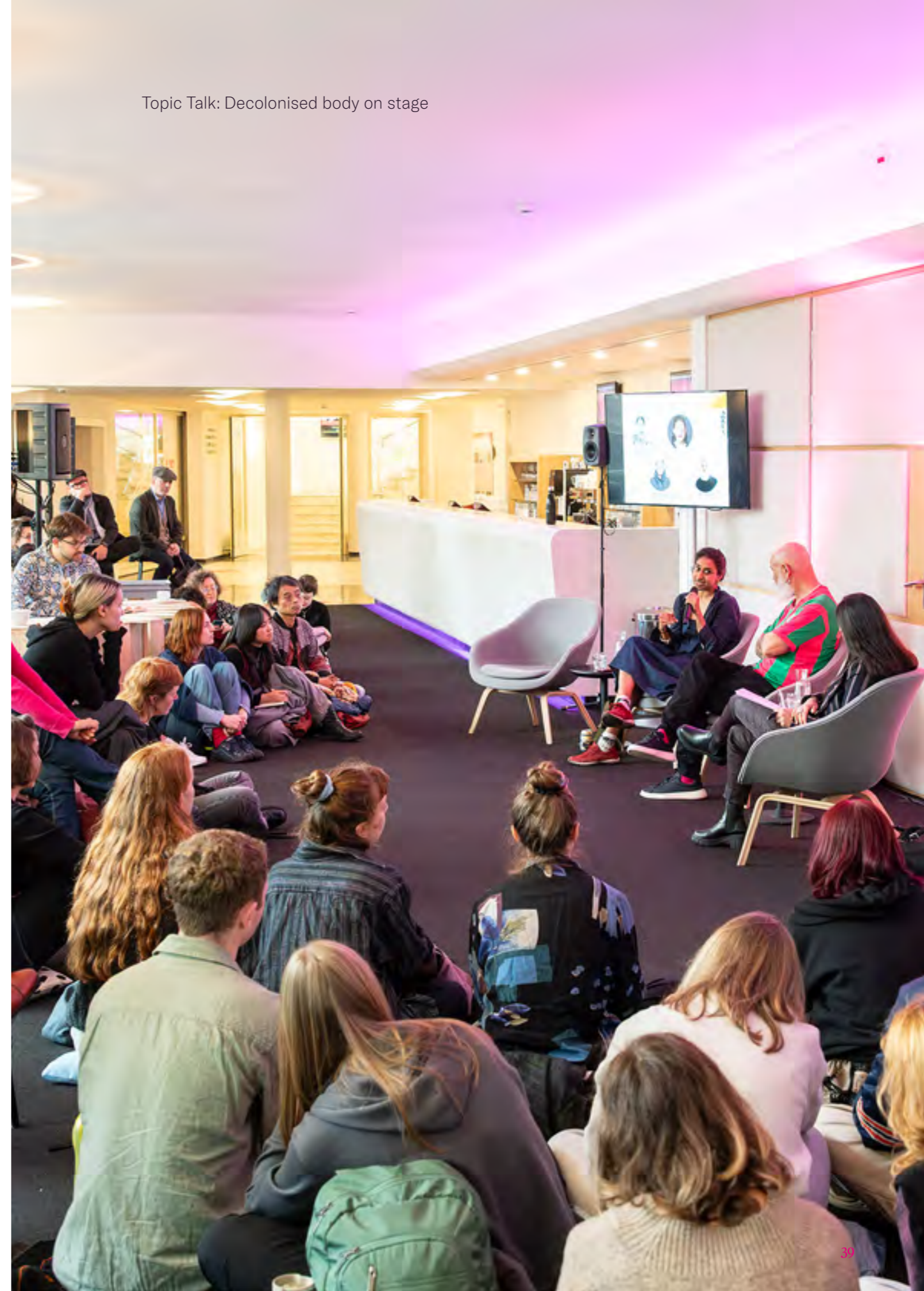
Topic Talk: Decolonised body on stage

We gebruikten deze presentatie ook als een korte training ter voorbereiding op het OFFSPRING-programma.