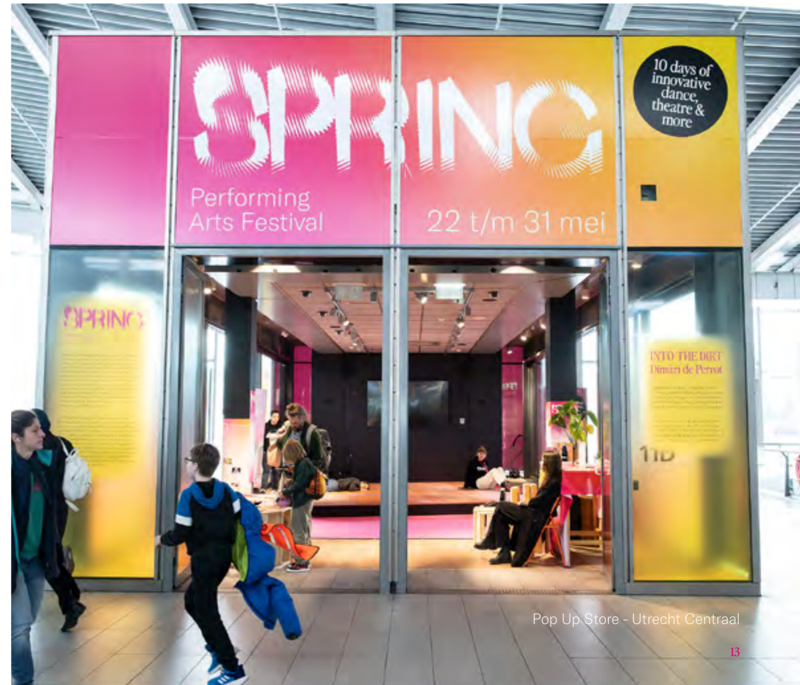
Pop Up Store - Utrecht Centraal

teken van experimenteren met de ontmoetingsplaatsen van het festival. Het programma van de SPRING Academy, inclusief de openbare onderdelen, werd na vele jaren in Het Huis te zijn gehuisvest, verplaatst naar De Berenkuil. Ook introduceerden we een dynamischer concept voor het festivalhart, waardoor het zich kon verplaatsen tussen locaties in de stad. De plek van het festivalhart was afhankelijk van waar het programma van die avond eindigde. Het slotevenement van het festival vond plaats in TivoliVredenburg, dat daarmee de feestelijke setting voor de afsluiting van het festival werd.