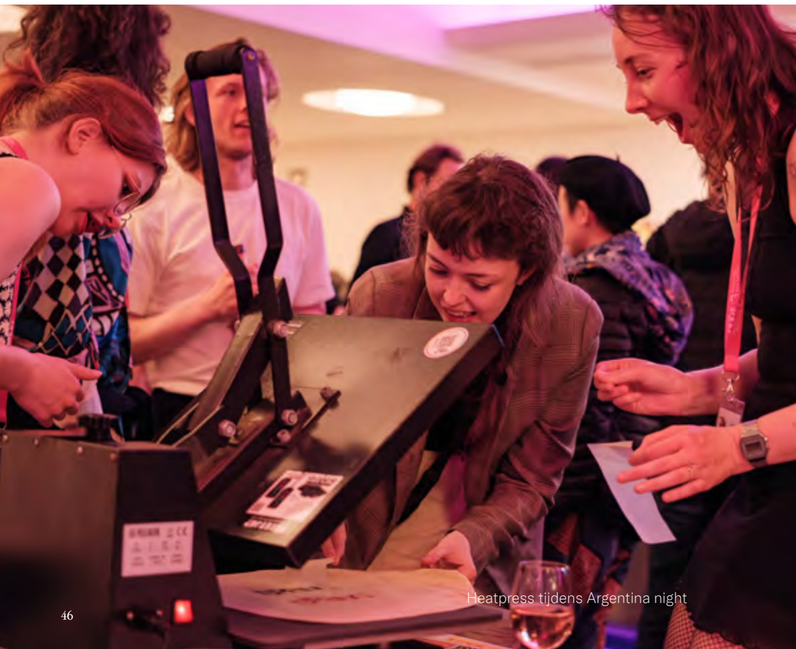
Heatpress tijdens Argentina night

Naast deze profielen uit het Culturele Doelgroepenmodel richten wij ons ook op de stadsgebruiker, door werk in de openbare ruimte te laten zien, de expat of internationale student, door internationale voorstellingen en veel 'language no problem' producties te presenteren, en een professioneel publiek uit de (podium)kunsten, inclusief studenten. Via de thematiek van ons festival en de producties die daar te zien zijn en via onze Stadsverbinding, vinden we daarnaast een breder publiek.