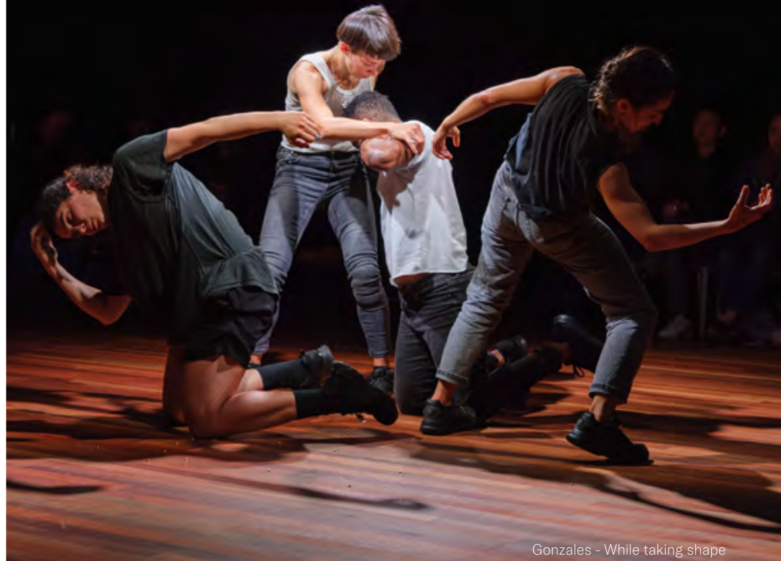
Gonzales - While taking shape