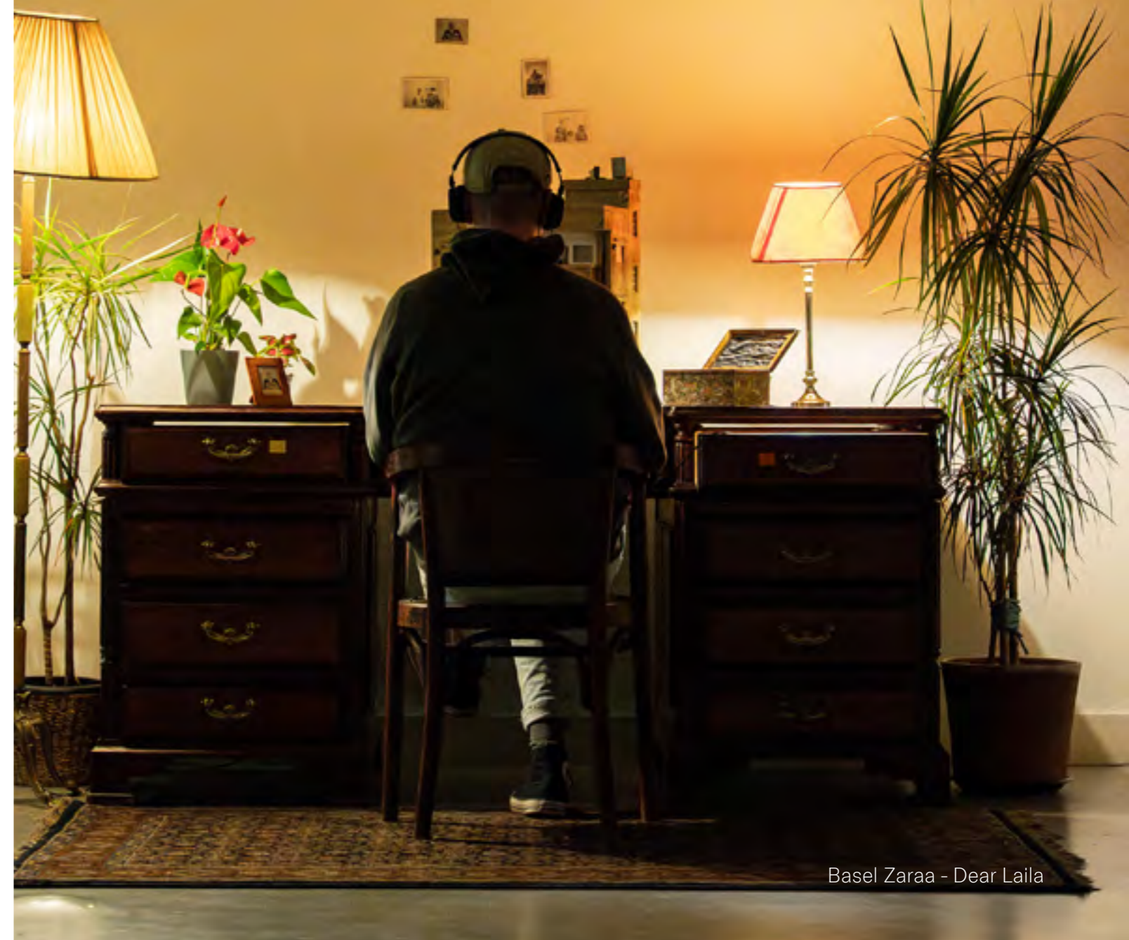
Basel Zarea - Dear Laila

SPRING blijft zich artistiek ontwikkelen, presenteert in Utrecht een internationaal festival op hoog professioneel niveau. Het bestuur en de Raad van Toezicht zijn tevreden over de prestaties en resultaten in 2025 en zien het vervolg van de periode 2025-2028 vol vertrouwen tegemoet. Dit is vooral ingegeven door de verkregen structurele subsidies van het Fonds Podiumkunsten, de gemeente en provincie Utrecht en vooral ook de vele private fondsen die SPRING steunen in de vruchtbare plannen voor deze kunstplanperiode. Grote dank gaat dan ook uit