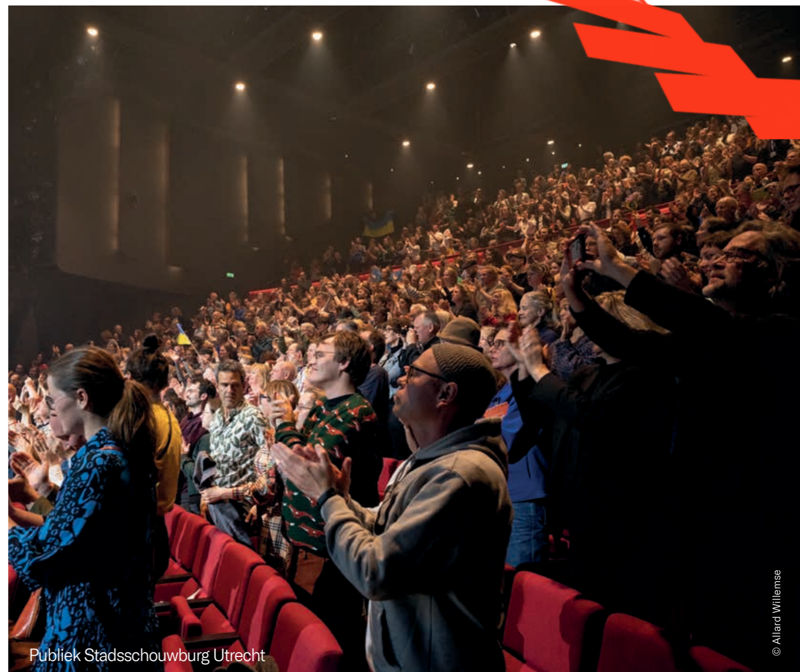
Publiek Stadsschouwburg Utrecht

voor productie van de verschillende festivallocaties, technische coördinatie, vrijwilligerscoördinatie en de gastenservice en een stagiaire en tijdens het festival met nog eens 4 extra locatiemanagers en extra technici. De marketingafdeling werd uitgebreid met 4 medewerkers waaronder de coördinator kaartverkoop en een stagiair. De administratief financieel medewerker nam de rol van online kassamedewerker op zich rond het festival. Voor SPRING Academy werden een medewerker productie en een stagiair aangetrokken. Hiernaast heeft SPRING in 2023 met 55 vrijwilligers gewerkt.