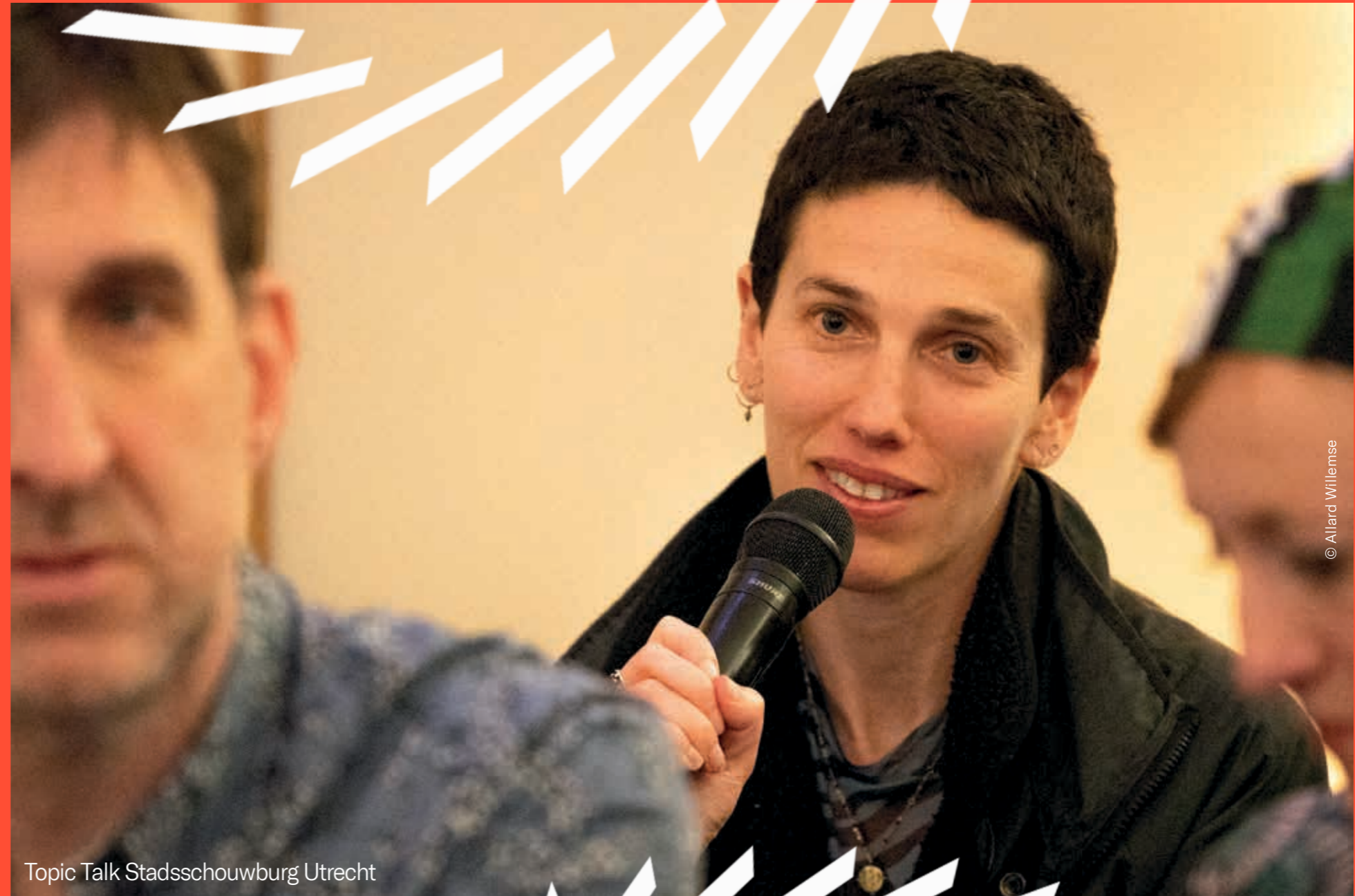
Topic Talk Stadsschouwburg Utrecht

Samen met de Metselarij organiseerden we een bijeenkomst voor deelnemers en oud-deelnemers van dit peer-to-peer leernetwerk voor nieuwe creatief producenten en programmamakers in de kunsten. We vertrokken vanuit de leervraag: Hoe zorg je ervoor dat een work-in-progress presentatie een wederzijds waardevolle ontmoeting is, voor zowel publiek als maker? OFFSPRING makers en partners namen ook deel aan het gesprek. Na een gezamenlijk maal bezochten de Metselaars de eerste OFFSPRING double bill.